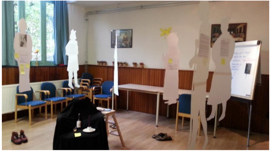
In de schoenen van .....