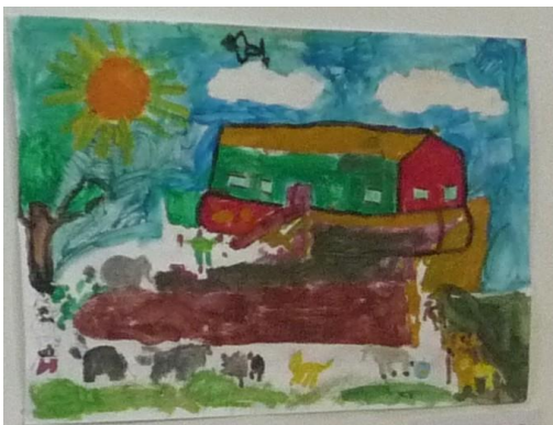
de ark van Noach groepswork Roermond