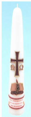
ds. Willem Vermeulen steekt de estafettekaars aan