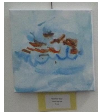
Storm op zee Moonay Say 5 jr. Geleen

In het ernaast gelegen Ontmoetingscentrum was een mooie tentoonstelling ingericht over de boekdrukkunst door het museum Oude Boekdrukkunst (De Gelderse Groep van Ambachten). Er werden korte films over boekdrukkunst van Plantin-Moretus (Antwerpen) gedraaid. En bij bibliodramagroep "Het Leerke" kon men in gesprek gaan met Luther bij "Stap in de schoenen van ...."