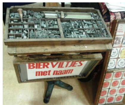
Een indruk van een oude drukkerij