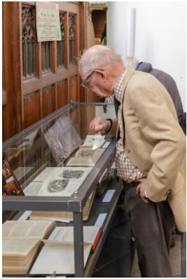
vitrine met oude Bijbels

Verder waren er vitrines met oude Bijbels en een schilderijen tentoonstelling van kinderen en jongeren. Ook het Nederlands Bijbelgenootschap was aanwezig met een tafel vol van de nieuwste Bijbel uitgaven.