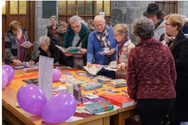
het Nederlands Bijbelgenootschap